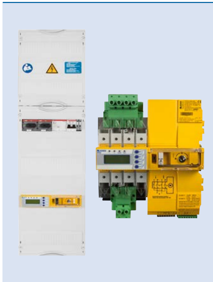
UMA710-2-...-ISO-BP (Beispielhafte Abbildung)